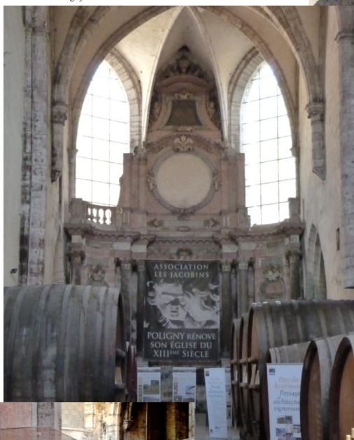
Pays du Revermont. Paysage et architectures vigneronnes à l'église des Jacobins de Poligny...